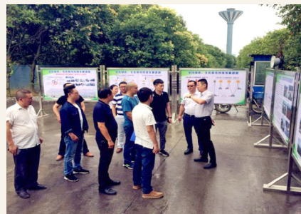
6月25日,四川省环境保护督察“回头看”督察组莅临德胜钒钛公司进行现场核查。(罗涛)